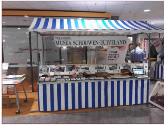
VMSSD stand op de nieuwe bewonersavond