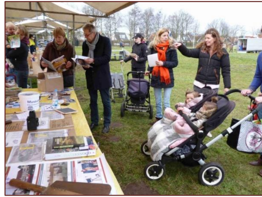
VMSSD stand op de Burghse Dag